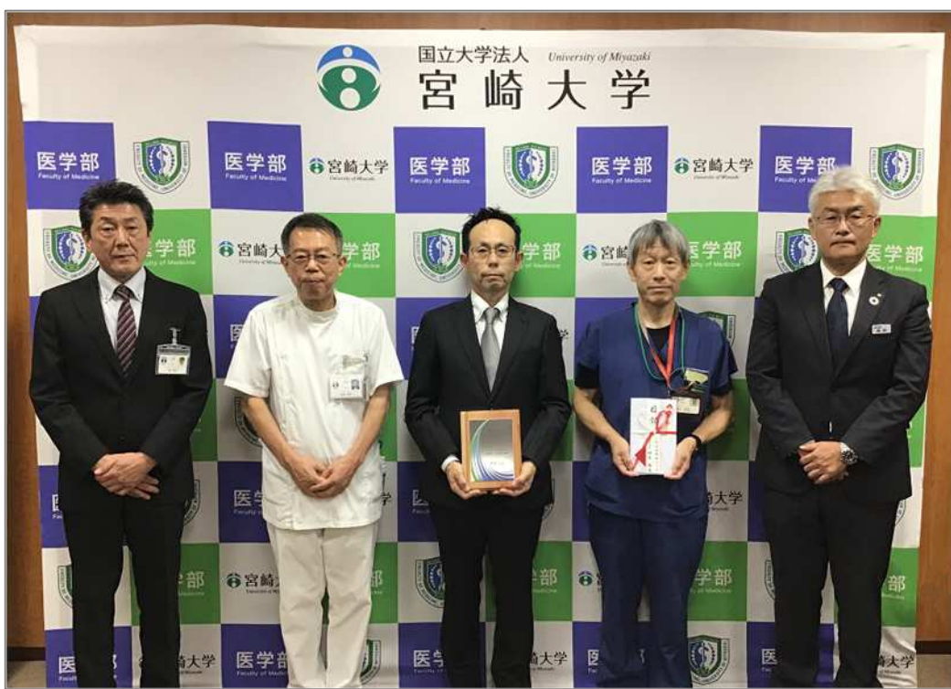
【左から山里事務部長、帖佐病院長、鈴木社長、落合センター長、桑畑支店長】