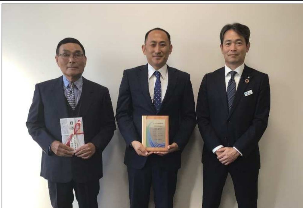
【左から櫻木会長、嶋末社長、和田支店長】