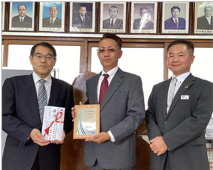
【左から前田校長、脇迫社長、和田部長】