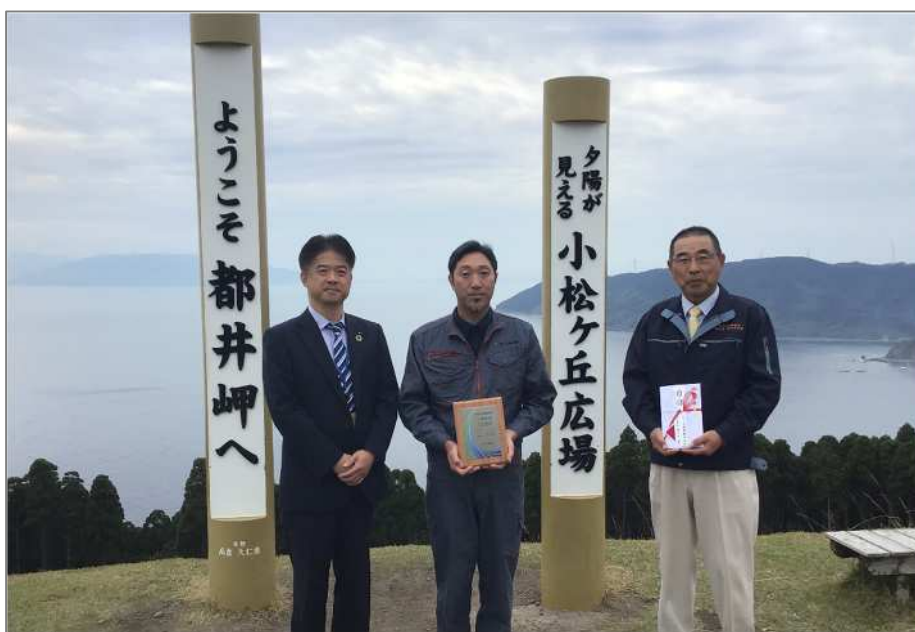
【左から新納支店長、坂ノ上社長、迫田組合長】