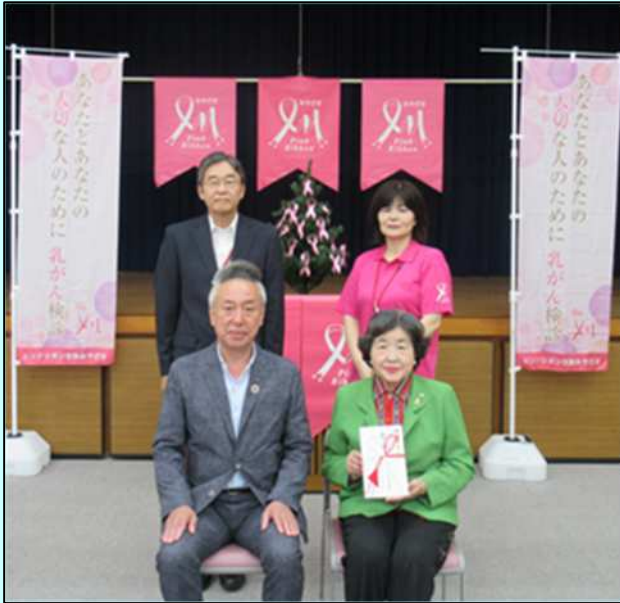
ピンクリボン活動みやぎ