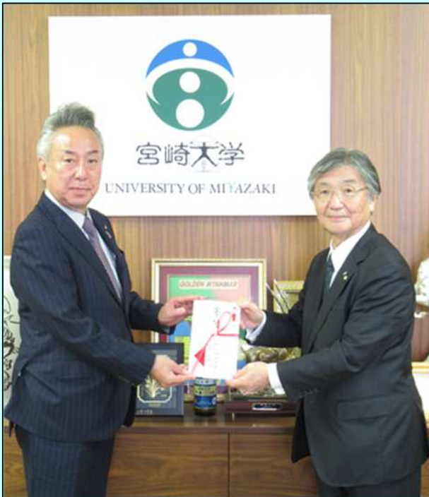
高等教育コンソーシアム宮崎