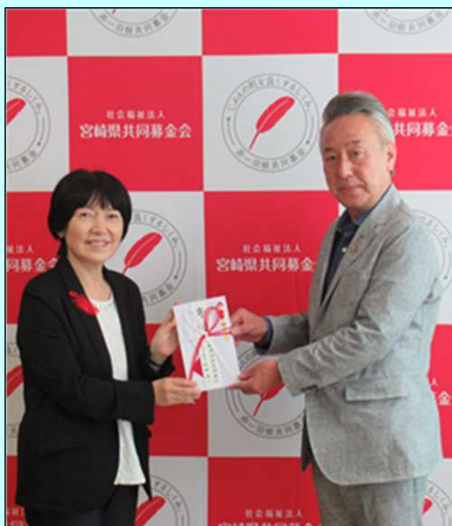
宮崎県共同募金会(赤い羽根募金)