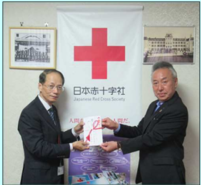
日本赤十字社 宮崎県支部