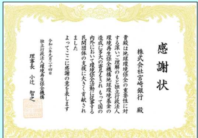
地球環境基金(独立行政法人 環境再生保全機構)